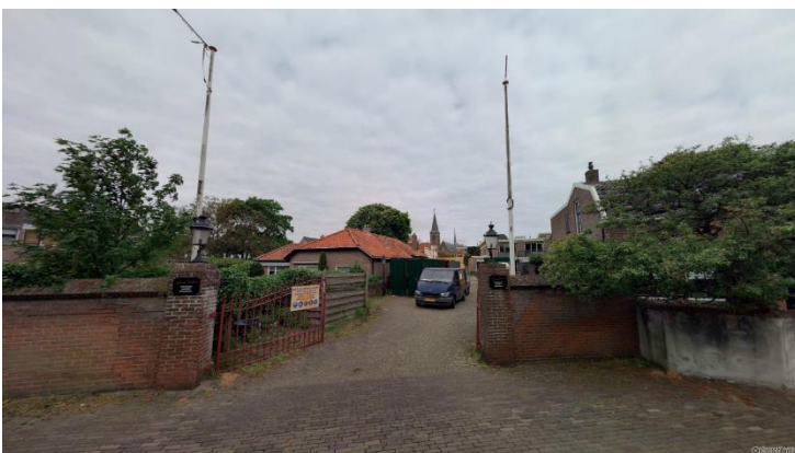
Blik op plangebied

Op het perceel Voorstraat 73a, 79 en 81 bevonden zich het hotel en restaurant Hof van Holland en het bijbehorende vakantieappartementen en –studiocomplex Ankerhof. Na een faillissement van de laatste exploitant medio 2010 is het gehele complex leeg komen te staan. Het ontbreken van toezicht en het niet onderhouden van het pand en terrein hebben geleid tot een vervallen staat. Om de exploitatie van het gebied te bevorderen heeft de gemeente op 25 september 2012 aangegeven open te staan voor een functiewijziging van hotel/restaurant naar horeca in combinatie met wonen. Het bestemmingsplan dat deze ontwikkeling mogelijk heeft gemaakt, 'Noordwijk Binnen: Hof van Holland', is in november 2014 vastgesteld. De omgevingsvergunning is reeds verleend door het bevoegd gezag, waardoor de realisatie van het herontwikkelingsplan 'Hof van Holland' op 15 april 2015 in gang is gezet.