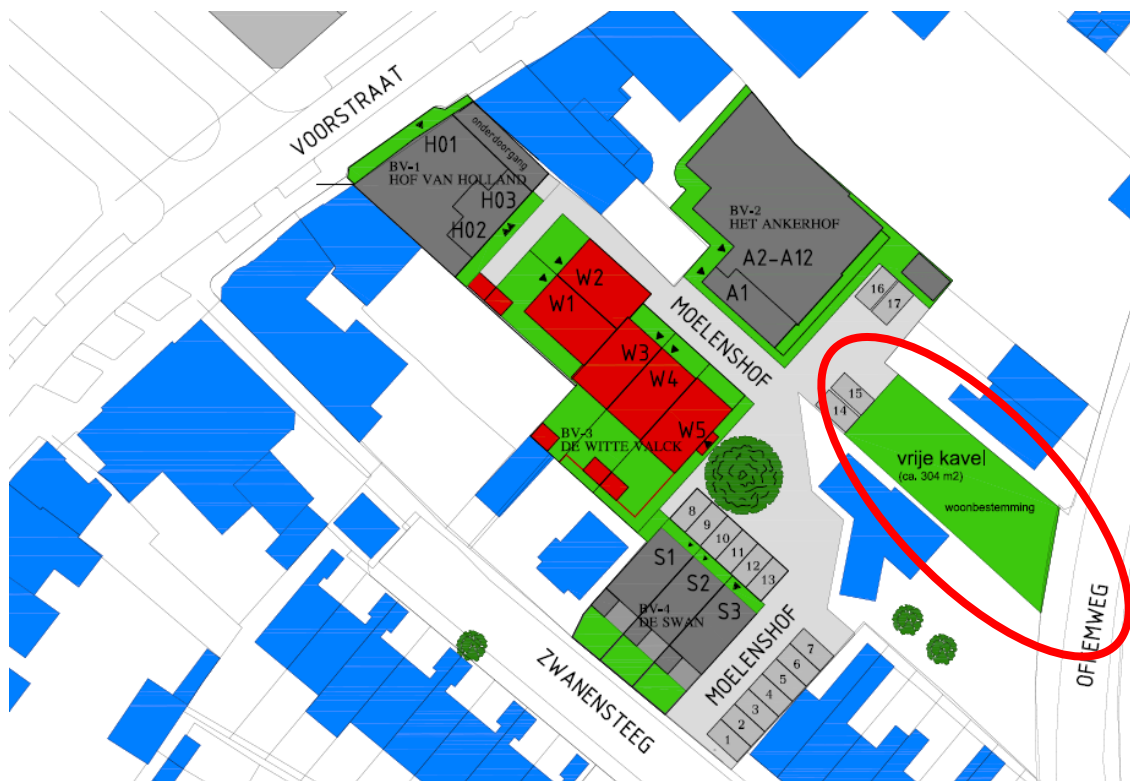
Nieuwe situatie herontwikkeling Hof van Holland, omcirkeld het perceel van het plangebied (Van Reisen Bouwmanagement & Advies, 10 januari 2014)

Het ontwikkelingsplan bestaat uit het realiseren van één woning op het perceel gelegen tussen de Offemweg 36 en 36a. Het initiatief betreft in feite het afronden van het bouwplan 'Hof van Holland', waarbij is ingezet op het ontwikkelen van een (woon)gebied dat past bij de kwaliteit en uitstraling van de plaats Noordwijk. Het uitgangspunt hierbij is om 'ruimte te laten': plekken te ontwerpen waar het karakter van de Voorstraat zich kan voortzetten en de nieuwe bebouwing naadloos zal worden opgenomen in het bestaande stedelijk weefsel.