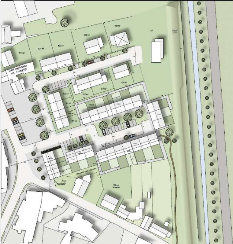
Figuur 2 Stedenbouwkundig plan