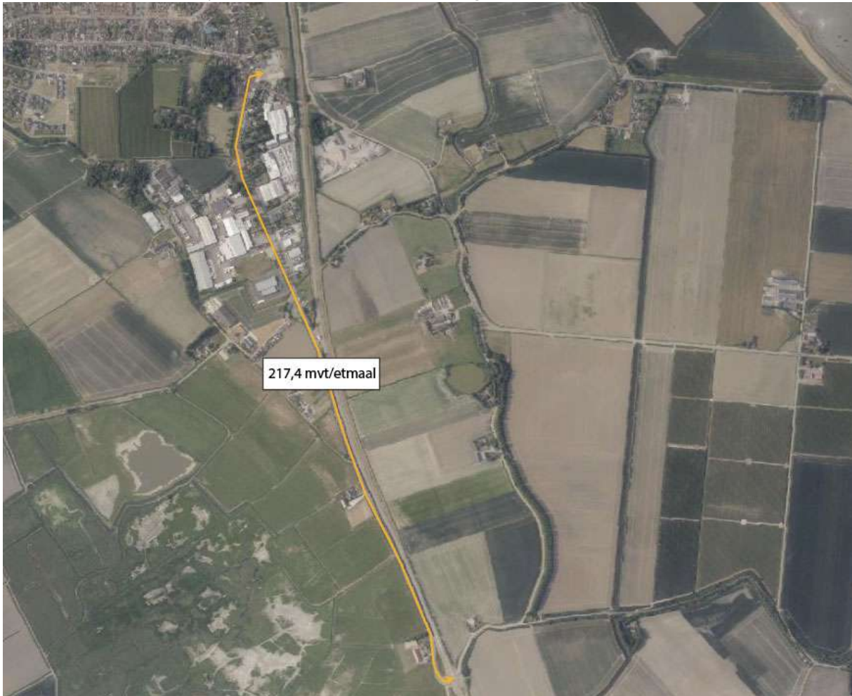
Figuur 3 Verkeersafwikkeling

Daarbij is er vanuit gegaan dat het verkeer via de Hulsterweg opgaat in het heersend verkeersbeeld op de N689. Dit is het geval op het moment dat het aan- en afrijdende verkeer, conform de Instructieregels voor AERIUS 2019A (juli 2020), zich heeft verdund tot enkele procenten van het reeds aanwezige verkeer.