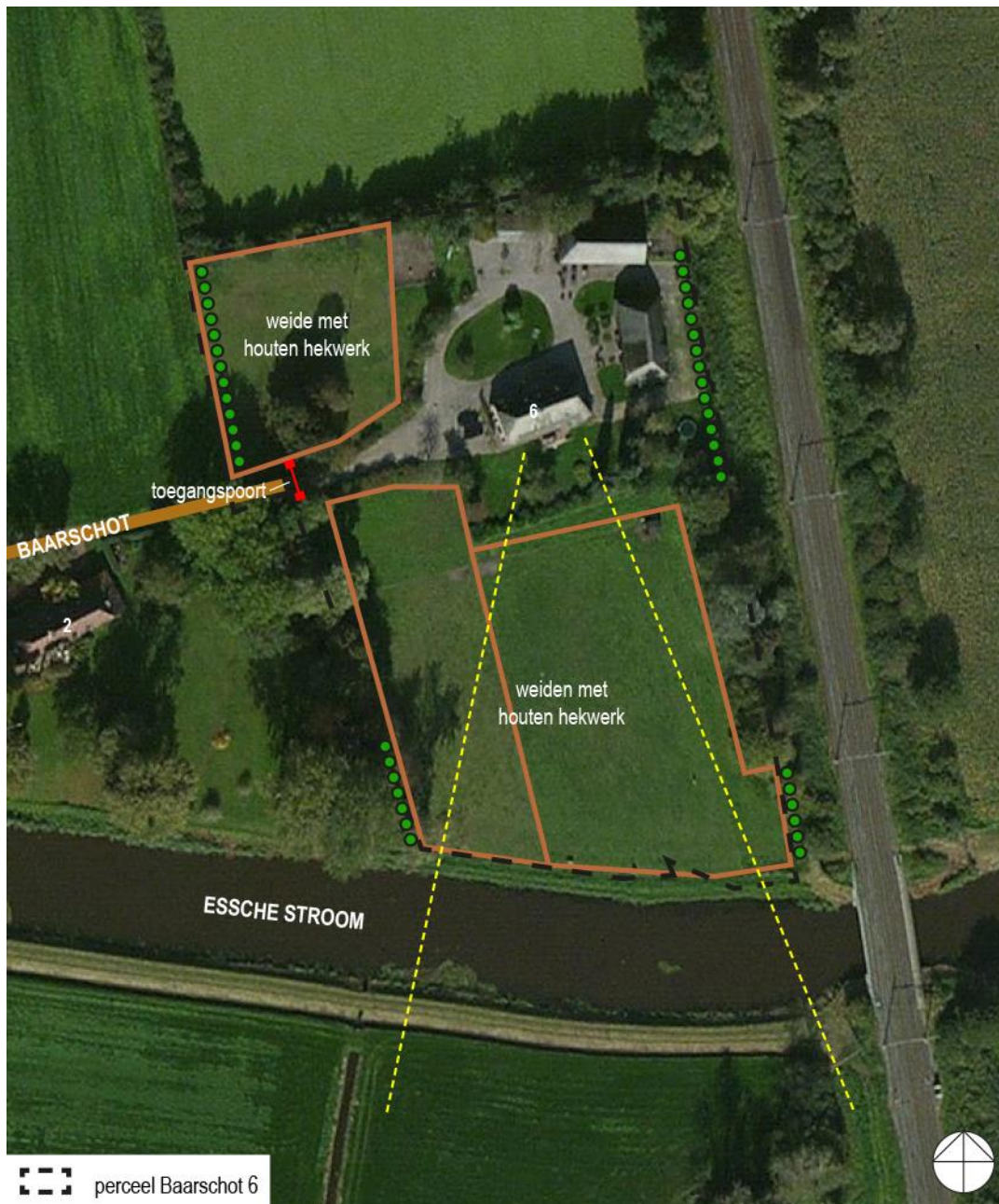
WOONPERCEEL EN OMGEVING

Het woonperceel is via de onverharde weg Baarschot ontsloten op de weg Groenendaal, die voorts de verbinding vormt met de kern Esch en het omliggende gebied. De Baarschot vormt als het ware een oprijlaan naar het fraaie boerenensemble, al fungeert deze tevens als de ontsluiting voor de meer bezijden gelegen woonboerderij Baarschot 2.