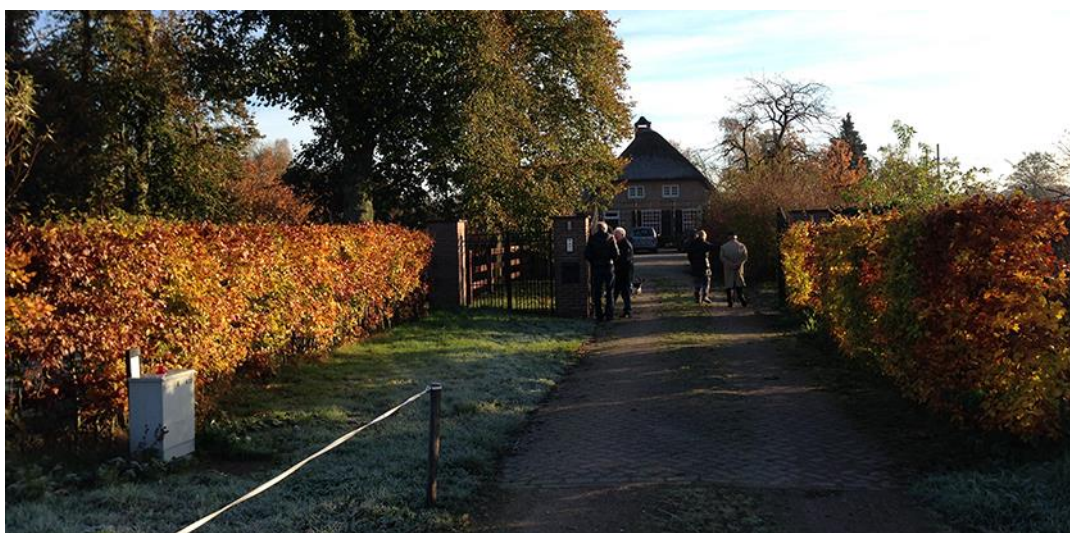
NIEUWE TOEGANGSPOORT (ZONDER LANTAARNS)

De nieuwe toegangspoort bestaat uit drie gemetselde pilaren met een hoogte van 2 meter en een sierhek met een hoogte van 2,2 meter. Op de pilaren worden nog lantaarns geplaatst. De totale poort heeft een breedte van circa 8 meter. De overige delen van het oorspronkelijke hek zijn vervangen door beukenhagen. Onderstaande foto toont de bestaande situatie met de nieuwe poort.