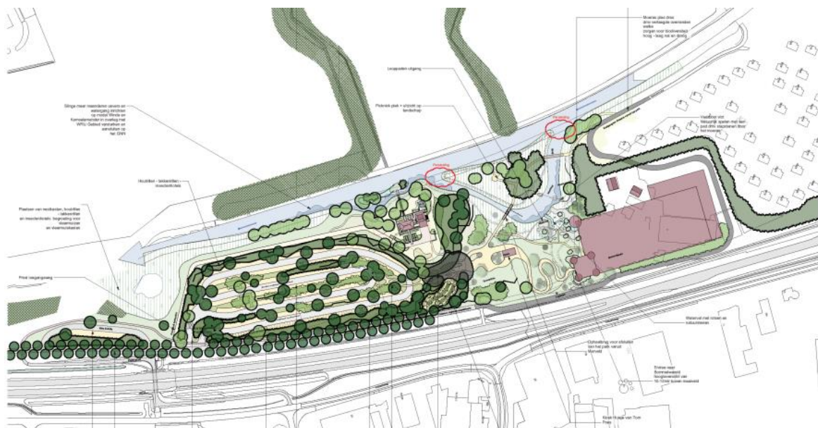
Impressie van de toekomstige inrichting (ontwerp: Studio Nico Wissing)

Het plan heeft geen samenhang met andere ontwikkelingen in de omgeving. Wel zal een de parkeerplaats deels ook als overloopparkerplaats gebruikt kunnen gaan worden voor bezoekers van het centrum van Groenlo.