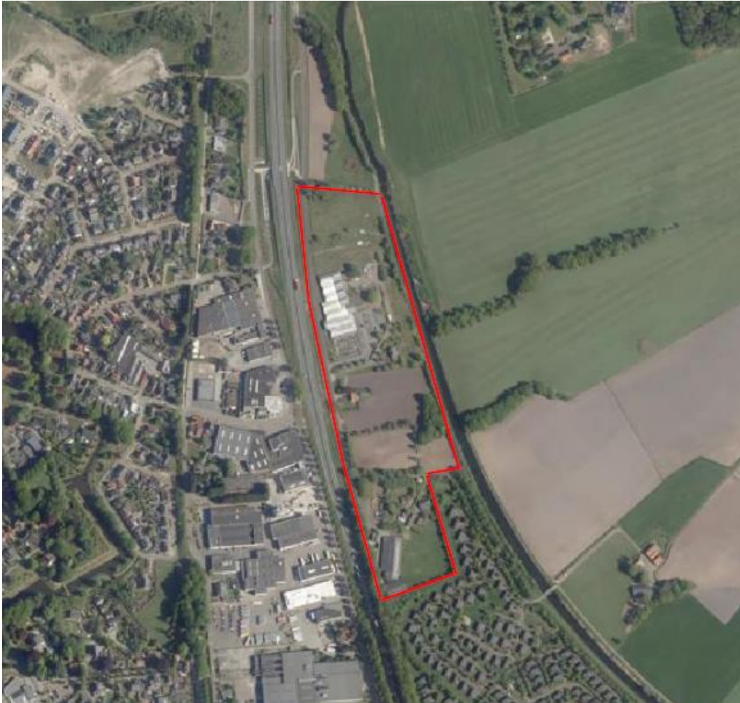
Luchtfoto van het plangebied en omgeving

Het plangebied ligt deels in de Groene Ontwikkelingszone (GO) en Gelders Natuurnetwerk (GNN), zoals is opgenomen in de Omgevingsverordening Gelderland. De niet in de GO of GNN liggende delen van het plangebied behoren tot het Nationaal Landschap Winterswijk. Daarmee ligt het plangebied in een zogeheten 'gevoelig gebied' zoals genoemd in de bijlage behorend bij het Besluit milieueffectrapportage.