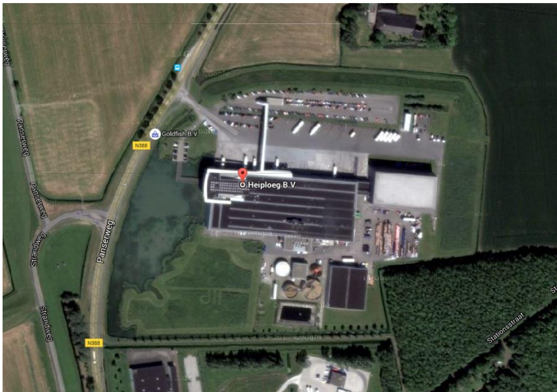
Heiploeg Zoutkamp

Het besluitgebied ligt ten noorden van de bedrijfsbebouwing. Onderstaande afbeeldingen geven een impressie van de bebouwing, de parkeervoorzieningen en overige voorzieningen in het besluitgebied.