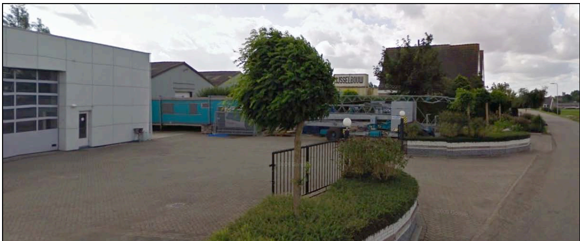
Afbeelding 2: Niet-watergerelateerde bedrijvigheid op de zelling

Van watergerelateerde bedrijvigheid is op Zelling Ver Hitland al een tijdje geen sprake meer. De meeste bedrijvigheid, waarvan een deel reeds is verdwenen, bestaat uit installatie- en bouwbedrijven. Deze bedrijven zijn allemaal verschillend gesitueerd op de bijbehorende percelen. Afhankelijk van de grootte van het perceel en situering van de loods, is de ruimte voor opslag en parkeren aan voor-, achter-, zijzijde of een combinatie daarvan te vinden.