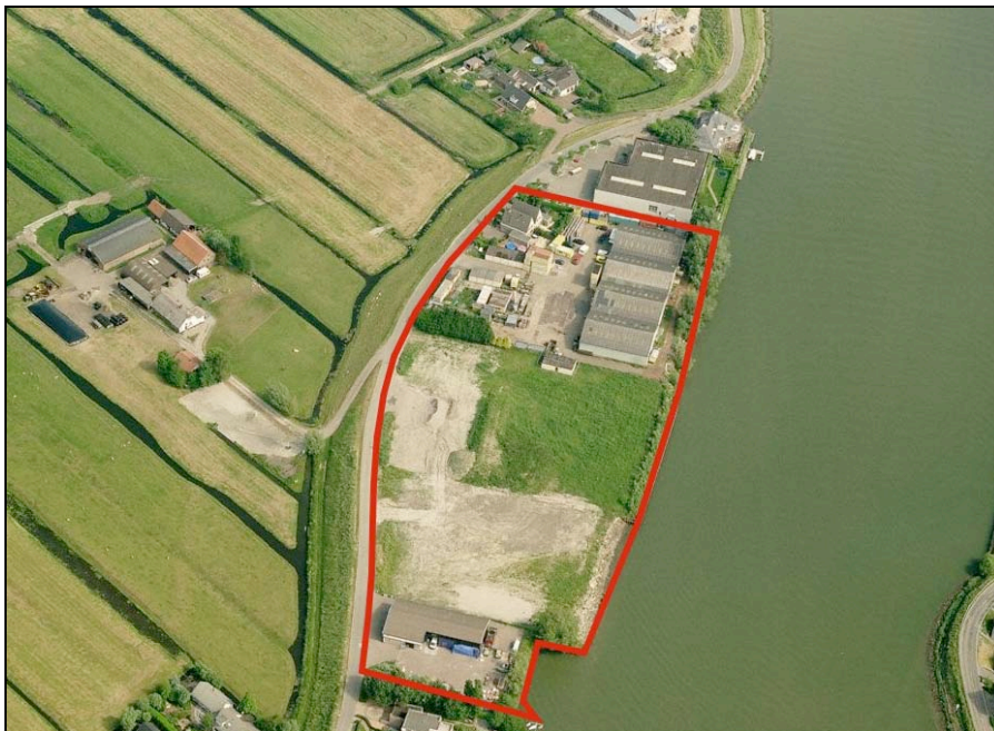
Afbeelding 1: Ligging van het plangebied

De zelling Ver Hitland is gelegen tussen de Hollandsche IJssel en de Groenendijk, ongeveer ter hoogte van de kern Ouderkerk aan den IJssel. Het plangebied omvat de gehele zelling, met uitzondering van het meest noordelijk gelegen perceel. Afbeelding 1 geeft de ligging en begrenzing van het plangebied aan.